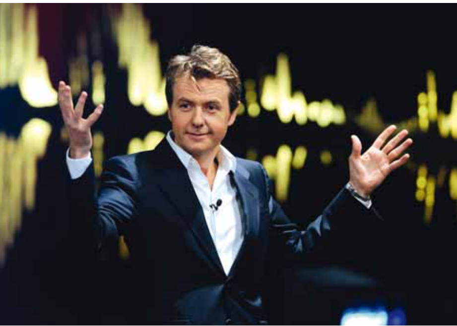
Efter tio år med talk-showsuccén "Först og sist" i Norge charmade Fredrik Skavlan internationella gäster och svenska tittare med programmet "Skavlan" i SVT.